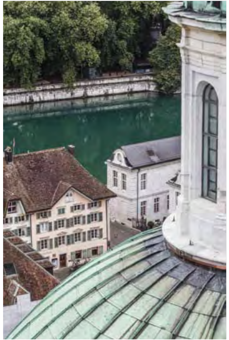
Oben: Rheinfall bei Schaffhausen Rechts: Aare bei Solothurn Unten: Rhein bei Basel