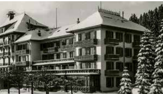
Grand Hôtel des Rasses St-Croix grandhotelrasses.ch

Designhotels. Die schweizweit einmalige Kooperation wurde 2004 gegründet und umfasst inzwischen 58 historische Betriebe – von Landgasthöfen über Kurhäuser bis zu 5-Sterne-Palästen, von Jugendstil-Monumenten über Bauhaus-Zeugen und Palazzi bis zu alpinen Refugien. Wir stellen in dieser Auswahl drei Westschweizer Betriebe in Wintersportgebieten, einen Geheimtipp im Kanton Jura, eine Wellness-Oase im Emmental und das jüngste SHH-Mitglied in Thun vor. ■