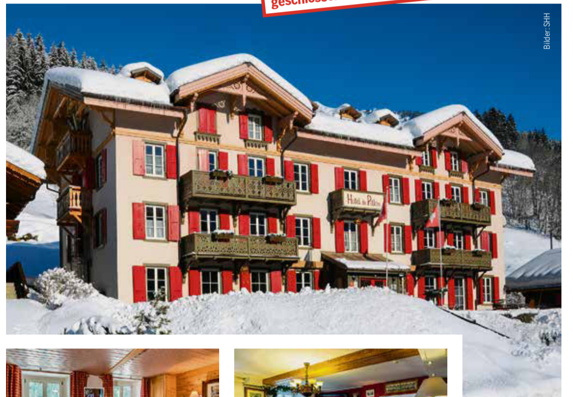
Hotel du Pillon Les Diablerets hoteldupillon.ch

Wegen Renovationsarbeiten ist das Hotel bis circa Weihnachten geschlossen.