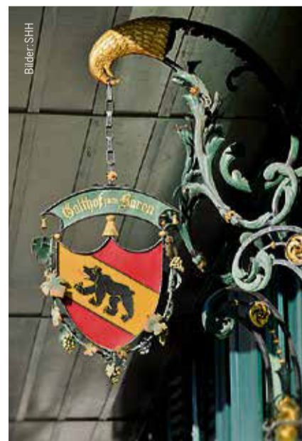
Romantik Hotel Bären Dürrenroth baeren-duerrenroth.ch

In Arolla kommen aber nicht nur Nostalgiker der Alpinhotellerie auf ihre Rechnung, sondern auch Liebhaber alter Skilifte: Wer mal nicht die Felle anschnallen will, kann sich auf nicht weniger als fünf Poma-Liften (die mit den riesigen Drehrädern) einen Teller unterklemmen. Für Skiliff-Nerds gilt das sesselbahnfreie Arolla als rarer Hotspot. ■