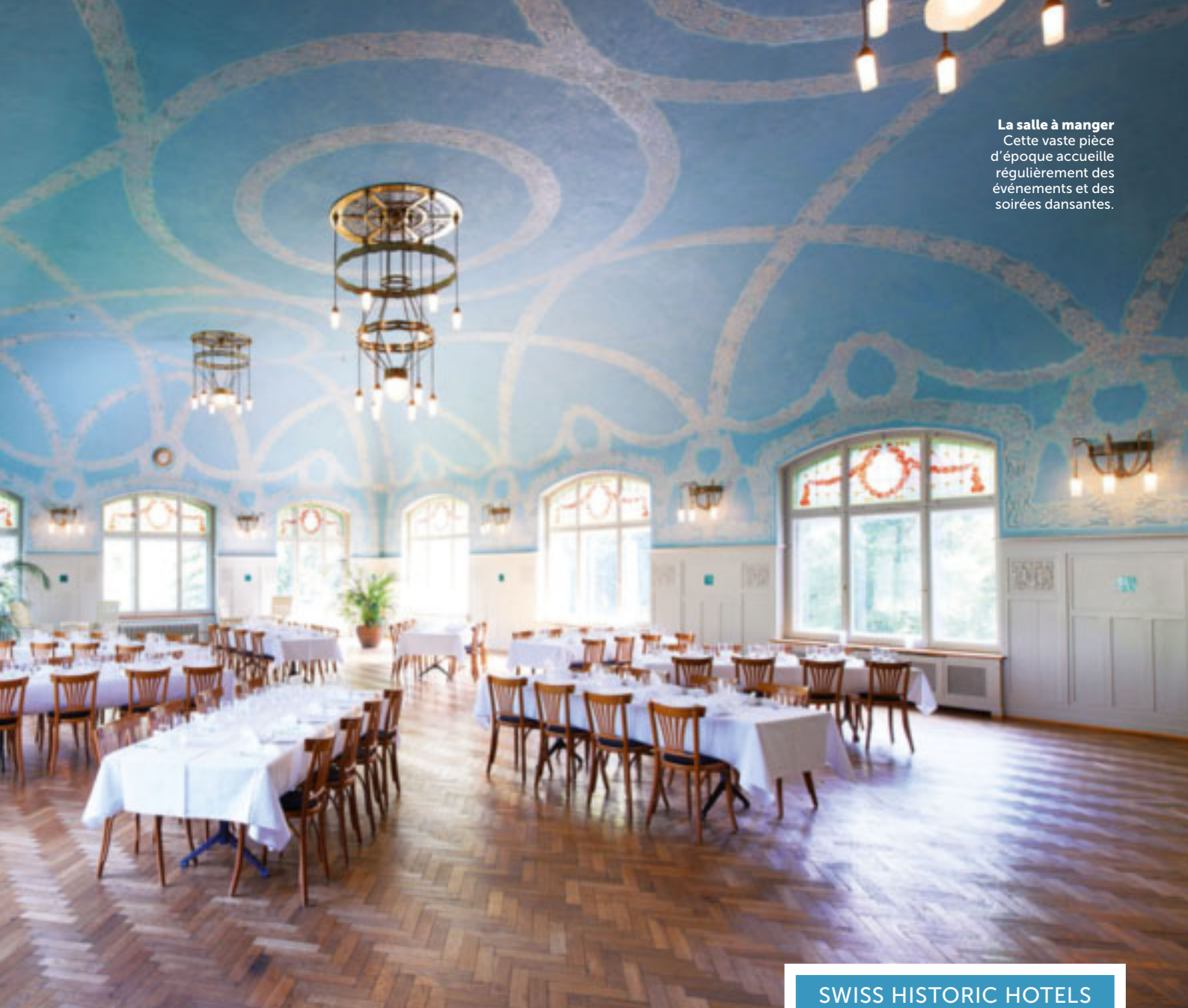
La salle à manger Cette vaste pièce d'époque accueille régulièrement des événements et des soirées dansantes.

quelques années, la clientèle, essentiellement helvétique, est en constante augmentation. Doté de 70 chambres et 140 lits, l'établissement affiche régulièrement complet durant les vacances scolaires ainsi que pendant les week-ends. Au chapitre des points forts de l'histoire récente du Kurhaus de Bergün figure sa