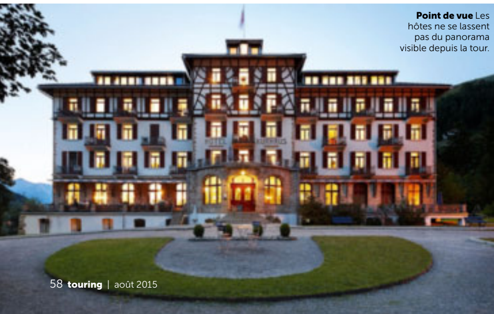
Point de vue Les hôtes ne se lassent pas du panorama visible depuis la tour.