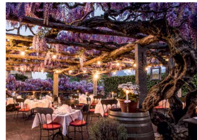
Zeitreise im Tessin: das Romantik Hotel Villa Carona im 200 Jahre alten Patrizierhaus im Künstlerdorf Carona mit viel mediterranem Charme.